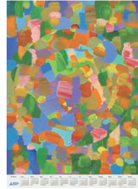
POSTER CALENDAR 2016 三菱製紙株式会社