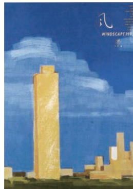
風景 WINDSCAPE 1993 TOKYO ADC 40th Anniversary Exhibition