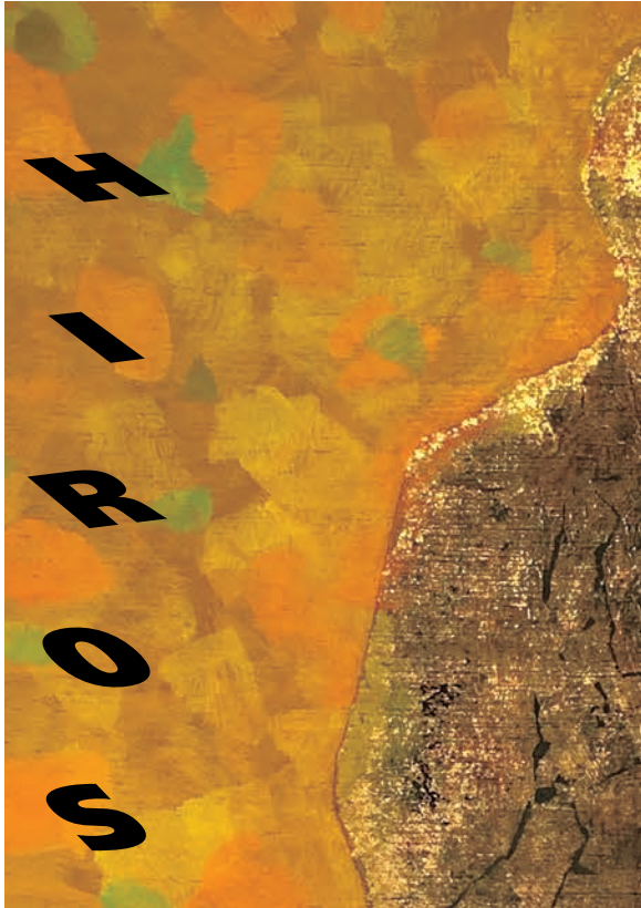
Kamijyo Takahisa Graphic Exhibition / HIROSHIMA APPEALS 2016 (部分)