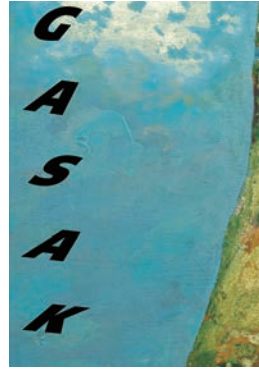
NAGASAKI APPEALS 2016 (部分) Kamijyo Takahisa Graphic Exhibition