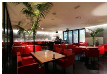
■1F レストラン&バー「NEW YORK CAFE」