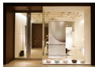
■1F ギャラリー「オリエンタルデザインギャラリー」