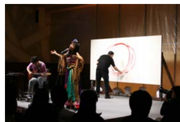
■川の町でミーティング 「核兵器のない未来に ピカドンを越えて」