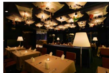
■23F モダンイタリアン「MOON GLOW」

ビューティーサロン「W.」 / フォトスタジオ「ALLURE」 / ギャラリー「オリエンタルデザインギャラリー」