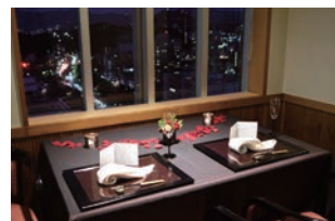
みつき店内イメージ