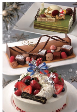
クリスマスケーキ

■予約受付期間：2017年11月1日(水)～12月20日(水)17:00まで *11月30日までのご予約で10%OFF