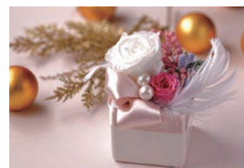
プリザーブドフラワーのアレンジメント