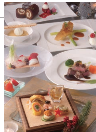
ムーングロー クリスマスディナー