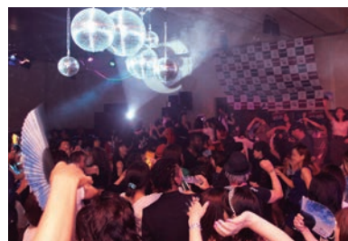
過去に開催したNew York New Yorkの様子

お申込・お問い合わせは オリエンタルデザインギャラリー TEL. 082-240-9463 (11:00～19:00受付) DJ.SALLY TEL. 090-4482-6128 株式会社オーロインターナショナル mail:oro_international3@yahoo.co.jp 【チケットWEB購入】オリエンタルホテル広島HP http://www.oriental-hiroshima.com/event/nyny20.html 【セブンチケット購入】 http://7ticket.jp/s/047061/