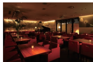
ニューヨークカフェ店内