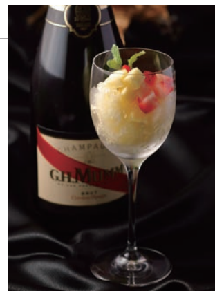
ドリミネーションカクテル 2019

■ご予約・お問合せ：ニューヨークカフェ TEL. 082-240-5567(直)