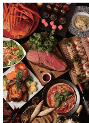
クリスマスディナーbuffet 料理イメージ

■ご予約・お問合せ：ニューヨークカフェ TEL. 082-240-5567(直)