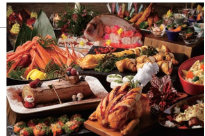
ムーングロー クリスマスディナーbuffet

クリスマス・イブの1夜だけ、夜景きらめくホテル最上階のバンケットに、ご家族や大切な方と楽しく過ごす聖夜のためのクリスマスbuffetが登場。ツリーが映える白の空間には、色鮮やかな料理がずらりと並びます。大きなチーズの器の中で作るカルボナーラや、目の前でシェフが炙る国産牛ロース肉のスペシャルメニューはもちろん、お子様が大好きなハンバーグや海老フライもご用意。お子様には、ホテルから真っ赤なサンタブーツ入りのお菓子をプレゼント。