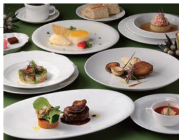
クリスマスディナーコース イメージ