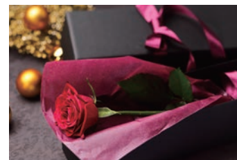
1輪の赤い薔薇(専用BOX入り)