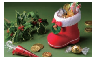
お子様へのプレゼント イメージ