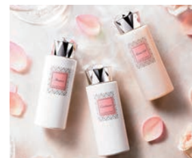
ジル・スチュアートバスタイムセット