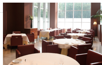
フレンチレストラン OZAWA 店内

オリエンタルホテル広島は、株式会社ホテルマネージメントジャパンのグループホテルです。