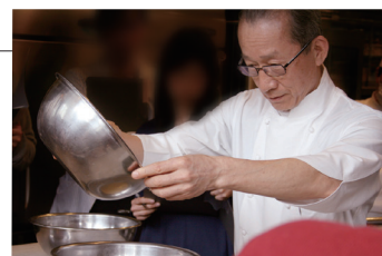
料理教室 開催風景