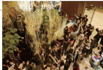
カウントダウンイベントの様子